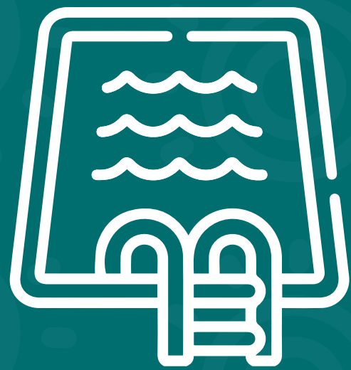
Piscina para adultos y niños