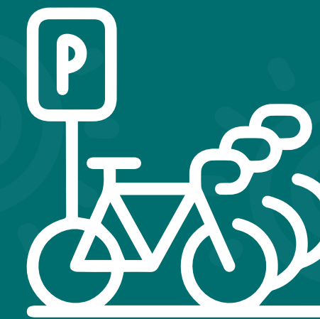
Parqueadero de Bicicletas