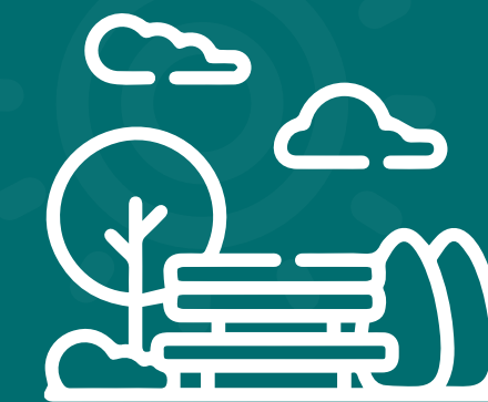
Parques Gimnasio + BBQ+ Juegos infantiles

Zonas comunes de uso exclusivo de los copropietarios