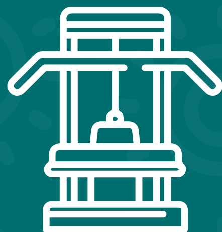
Gimnasio semidotado estilo crossfit cubierto